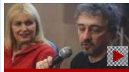
FACE & BOOK - "Omicidio a piazza Bologna" di Armando Palmegiani