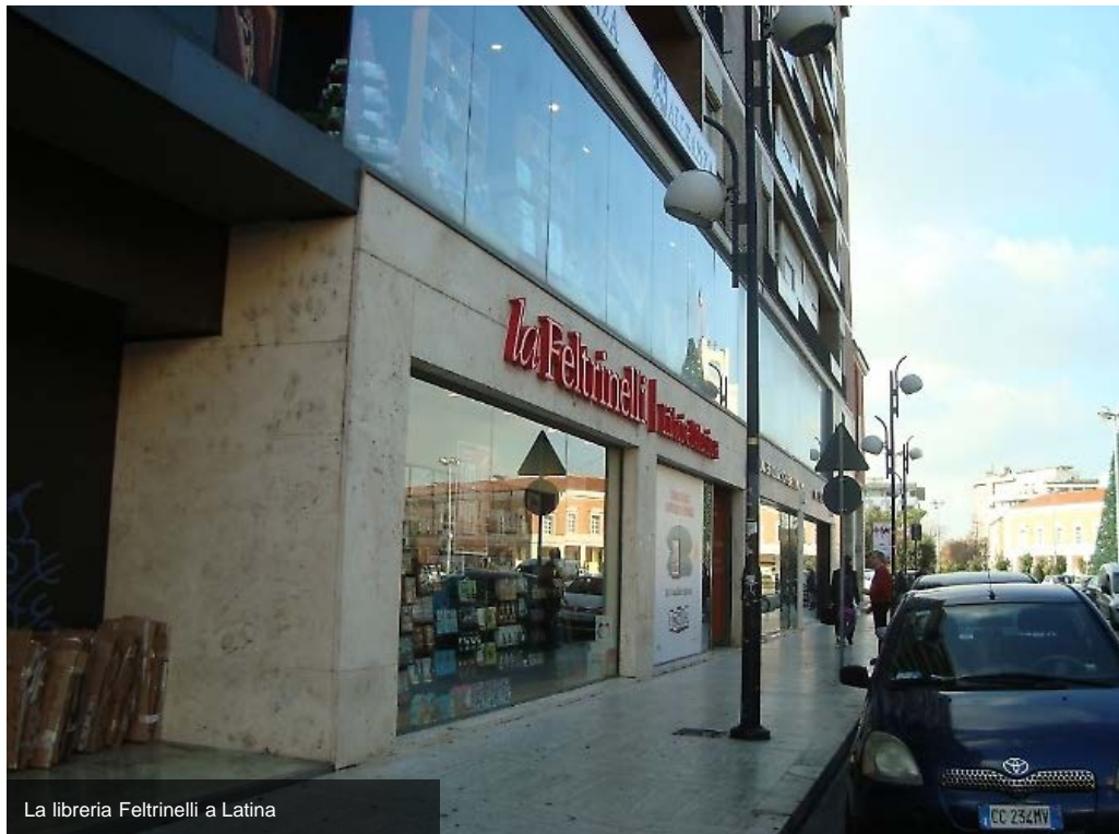
La libreria Feltrinelli a Latina